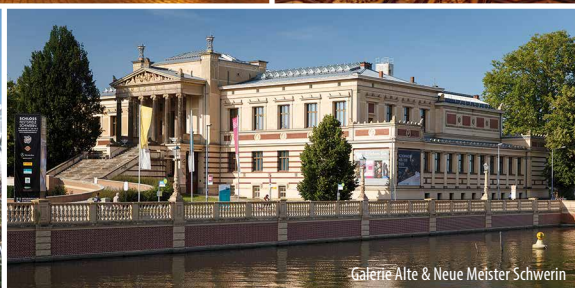
Galerie Alte & Neue Meister Schwerin